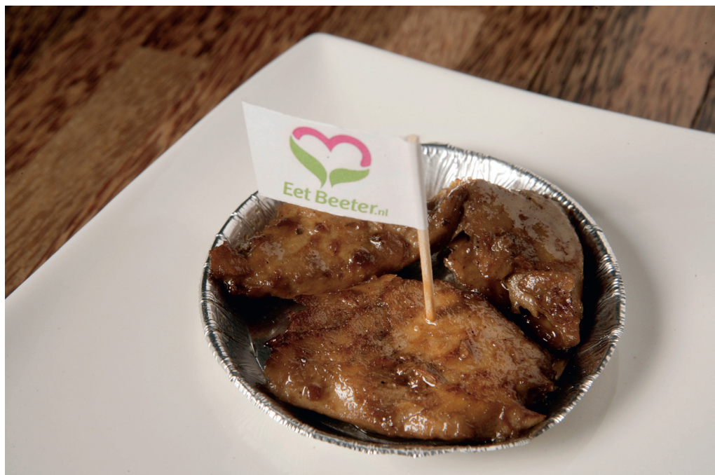
De eerste versie van Beeter® heeft kenmerken van gegaarde kipfilet.

Het Wageningse bedrijf Ojah heeft een nieuwe vleesvervanger in de markt gezet. De eerste versie van het plantaardige product Beeter® is nog wel het beste te vergelijken met gegaarde kipfilet.